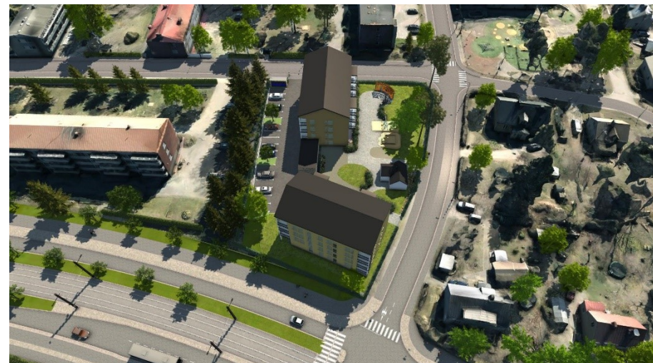
Havainnekuva yläviistosta luoteen suunnalta.

Hule-42(1) Kiinteistön vettäläpäisemättömillä pinoilla syntyvät hulevedet tulee ensisijaisesti imeyttää tontilla. Mikäli imeyttäminen ei ole mahdollista, tulee vettäläpäisemättömiltä pinoilta tulevia hulevesiä viivyttaa tontilla siten, että viivytysrakenteiden mitoitustilavuus on suluissa mainittu kuutiometrimäärä jokaista sataa vettäläpäisemätöntä pintaneliometriä kohden. Viivytysrakenteiden tulee tyhjentyä 12 tunnin kuluessa täyttymisestään ja niissä tulee olla suunniteltu ylivuoto.