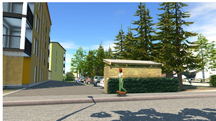
Havainnekuva Talvitien ja Härmälänkadun risteyksestä katsottuna.