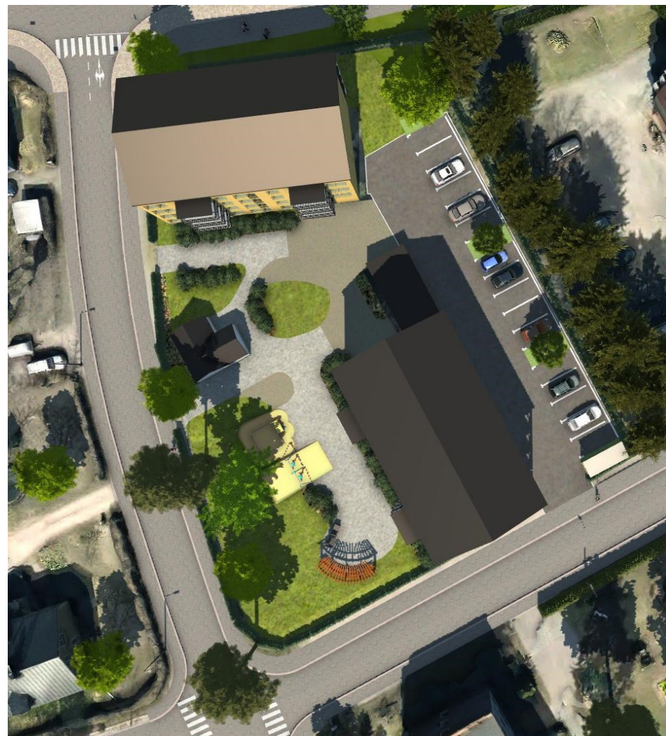
Havainnekuva suoraan ylhäältä.