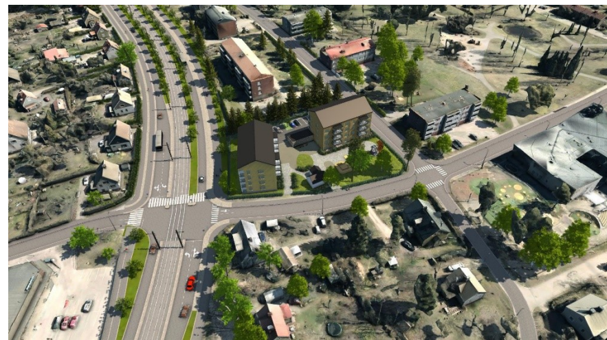
Havainnekuva yläviistosta lännen suunnalta.